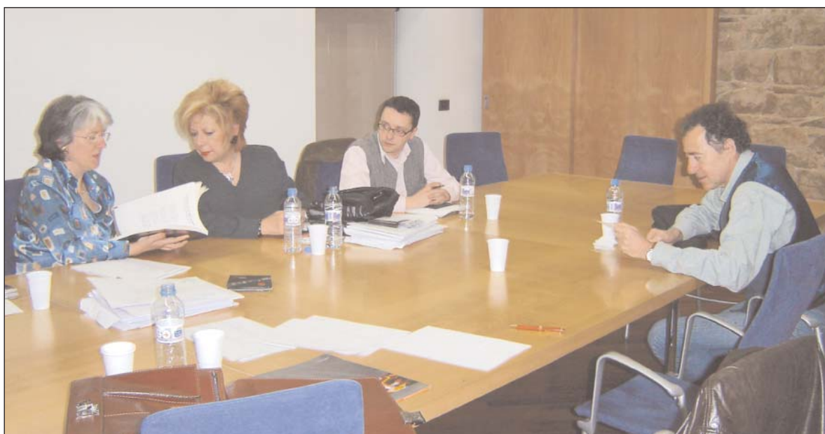
El jurat en plena feina

A finals de juny se celebrarà la festa de presentació oficial de la campanya, i a partir d'aleshores s'enviarà el CD amb els nous temes a totes les emissores de ràdio públiques i privades. També es lliurarà a les escoles i acadèmies de ball i es comercialitzarà a través d'una empresa distribuïdora. El DVD serà repartit a totes les televisions locals i posat a disposició del públic a través dels punts de venda habituals.