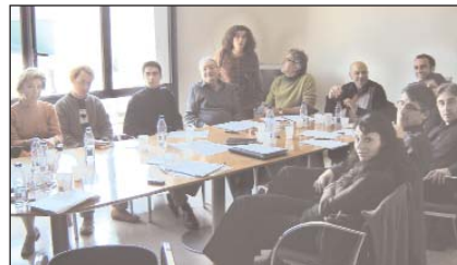
Una de les reunions de la Plataforma de la Cultura per a un Consell de les Arts.

Els professionals de les arts a casa nostra varen tenir l'oportunitat, com és molt natural, de manifestar la seva opinió sobre la constitució del Consell de la Cultura i les Arts de Catalunya. La seva veu va arribar al comissionat Josep M a Bricall a través de la Plataforma de la Cultura per a un Consell de les Arts, que és l'organisme que ha aglutinat als representants de les diferents associacions del sector, entre les quals hi figura la Unió de Músics. Aquesta plataforma va concretar els resultats de les seves nombroses reunions en l'anomenat Document de Sant Boi que segurament haurà estat una de les eines bàsiques del comissionat per elaborar l'informe que va entregar a la Consellera de Cultura tal com s'anuncia en aquestes mateixes planes.