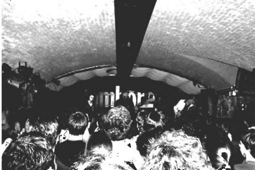
Festa campanya ASACC, Jamboree 06/02/2007

Sembla ser que el silenci es comença a trencar donant pas a l'harmonia. És un