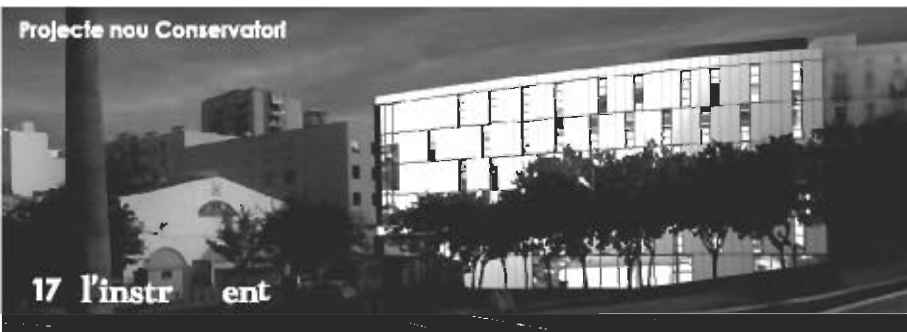
Projecte nou Conservatori